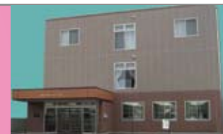
やさしさに包まれた住宅空間