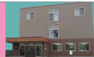
やさしさに包まれた住宅空間