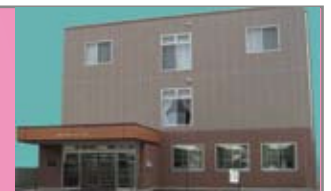
やさしさに包まれた住宅空間